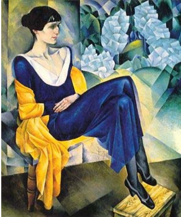
Nathan Altman Portrait of Anna Akhmatova 1914. Huile sur toile. 123.5 x 103.2 cm Le Musée russe, Saint-Petersbourg, Russie

Pour célébrer la Journée internationale des femmes et en ce lendemain d'élections russes, je vous fais découvrir la poétesse russe Anna Akhmatova par des extraits d'un Requiem qui constitue un cycle autobiographique tragique consacré aux victimes de la répression des années 30. Son nom et ce poème s'ajoutent à la liste de mes poètes de prédilection dont vous trouverez les textes dans la rubrique POÉSIE de mon site à l'adresse www.danielturp.org .