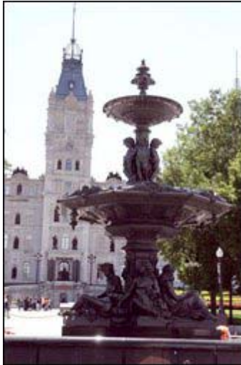
La fontaine de Tourny

Je rentre à Montréal ce matin après une agréable fin de semaine dans notre capitale nationale et une extraordinaire rencontre avec l'ensemble Hespèrion XXI à la salle Raoul-Jobin du Palais Montcalm. Sous la direction du maître catalan Jordi Savall et par la voix de Montserrat Figueras, ce grand ensemble catalan m'a entraîné dans des Paradis perdus samedi soir et en Orient-Occident hier soir.