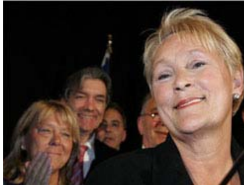
Pauline Marois

Après une réflexion que les événements des jours derniers ont accélérée, j'ai décidé d'apporter mon appui à Pauline Marois dans la course à la direction du Parti Québécois. En présence de plusieurs collègues de l'Assemblée nationale, je me suis rendu à Longueuil hier matin et ai pu entendre la candidate Marois présenter des orientations générales auxquelles j'adhère pleinement. Je me réjouis que Pauline Marois veuille véritablement mettre l'accent sur la définition du projet de pays. C'est d'ailleurs dans les termes suivants qu'elle a présenté sa vision d'avenir sur la question nationale : « Je propose que nous mettions de côté l'échéancier référendaire pour travailler sur le projet de pays, l'expliquer, en discuter et écouter les gens sur la façon dont ils le voient ».