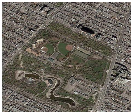
Le Parc Lafontaine... par Google Earth