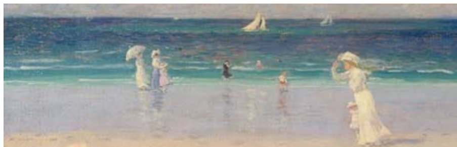
Clarence Gagnon Brise d'été à Dinard (détail), 1907. Huile sur toile. Coll. : MNBAQ

S'agissant d'expositions et d'arts visuels, j'ai vu le 16 juin 2006 l'exposition Clarence Gagnon au Musée national des Beaux-Arts de Québec. C'est à voir absolument... d'ici le 10 septembre 2006!